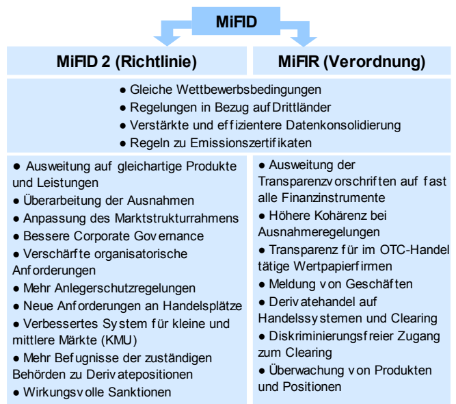
Grafik 1: Die wichtigsten geplanten Neuregelungen

umgesetzt werden müssen. Das Europäische Parlament und der Rat müssen jetzt auf Basis der Kommissionsvorschläge eine Position finden. Wie man in Tabelle 1 sieht, wird die Überarbeitung mindestens bis Herbst 2012 dauern, die endgültigen Verhandlungen wohl bis 2013.